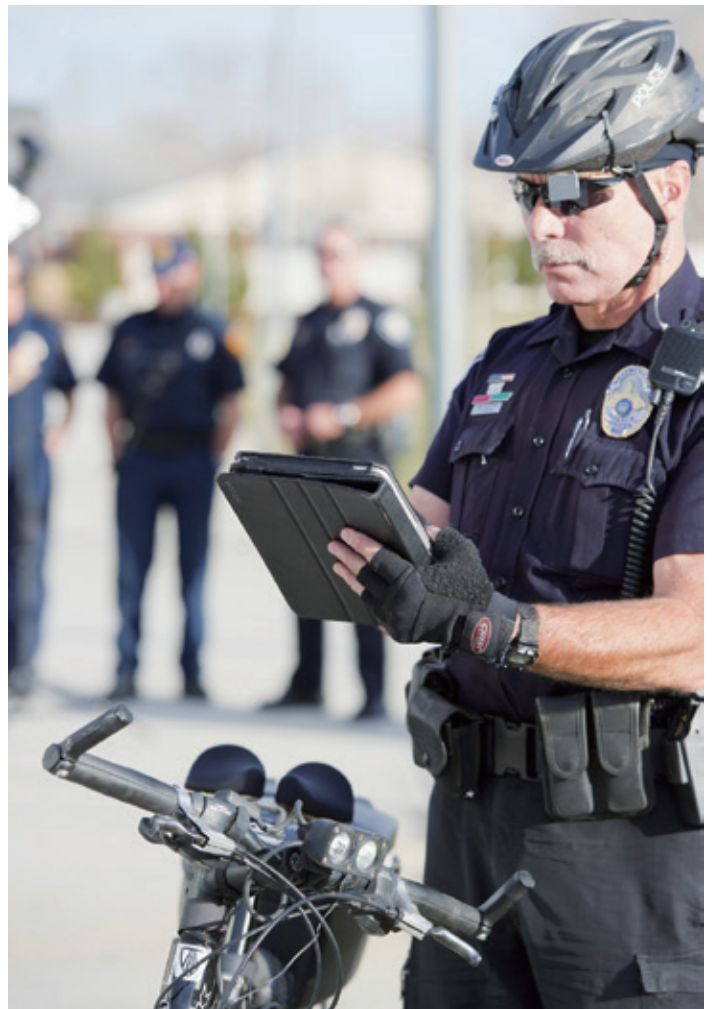
将海克斯康移动指挥调度系统搭载到智能手机或平板电脑上，使其更加易于使用。